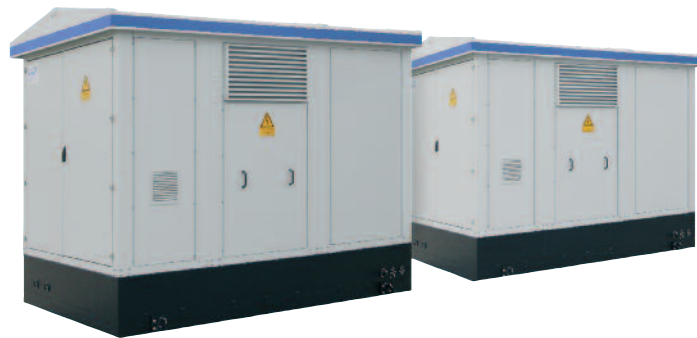
Beispiel einer PV-Netzstation PvTS